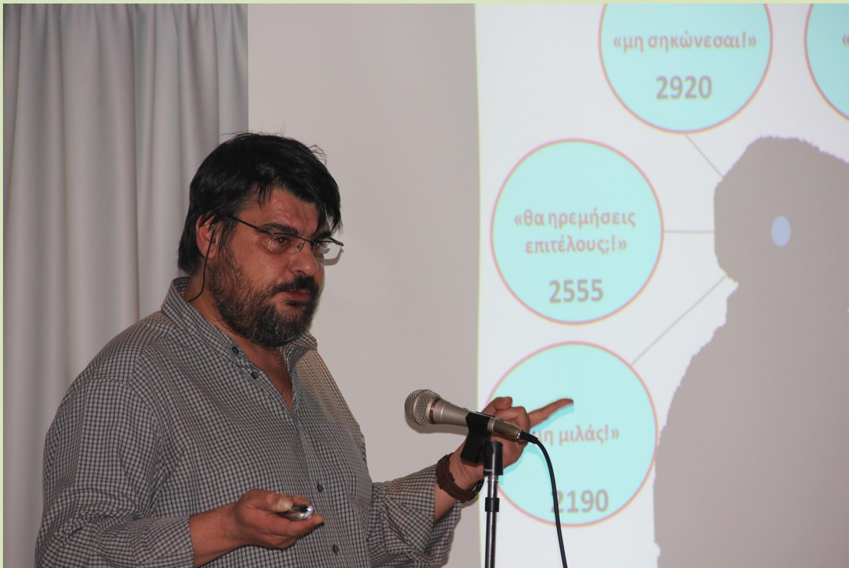
Προτάσεις για αύξηση της συγκέντρωσης στο σπίτι (μελετώντας και παίζοντας). (Αλεξάνδρου Στράτος)